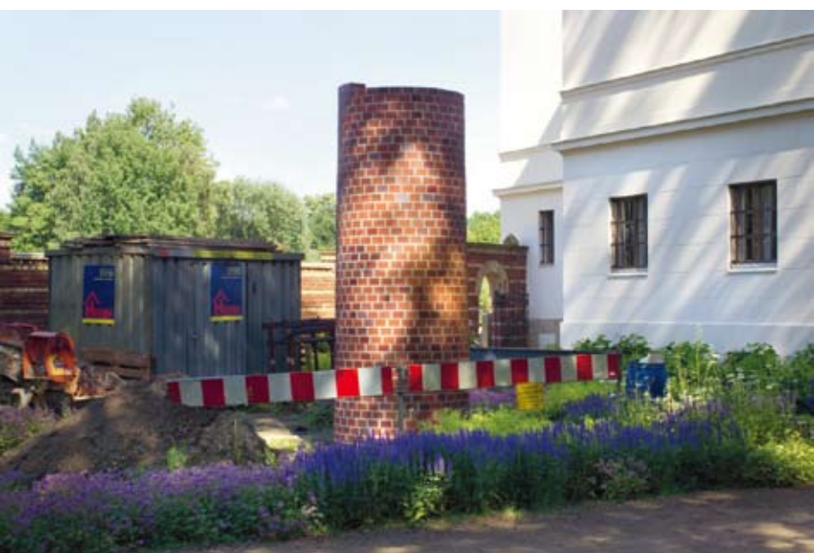
"Baustelle Villa Schöningen" installation på Museum Villa Schöningen, Potsdam, Tyskland 2011

– För mig är materialet viktigt. Om granitfundamentet en dag skottas över kommer det ändå att finnas kvar under jorden. Och hoppet om morgondagen finns där fortfarande.