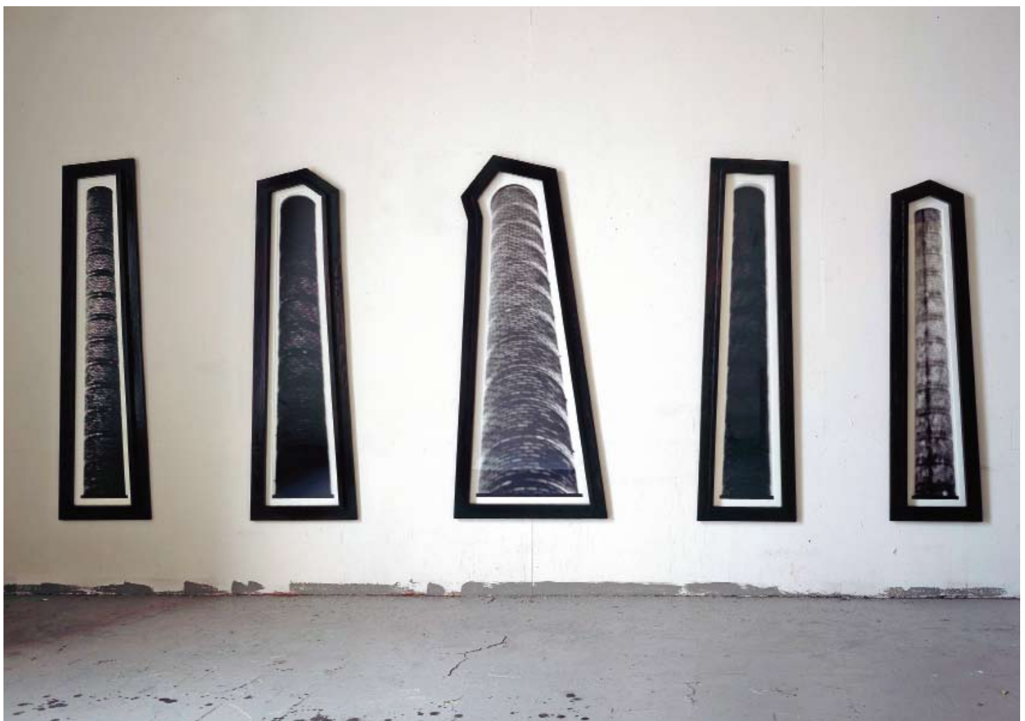
"Les Cheminées de Cologne", fotoobjekt 1988