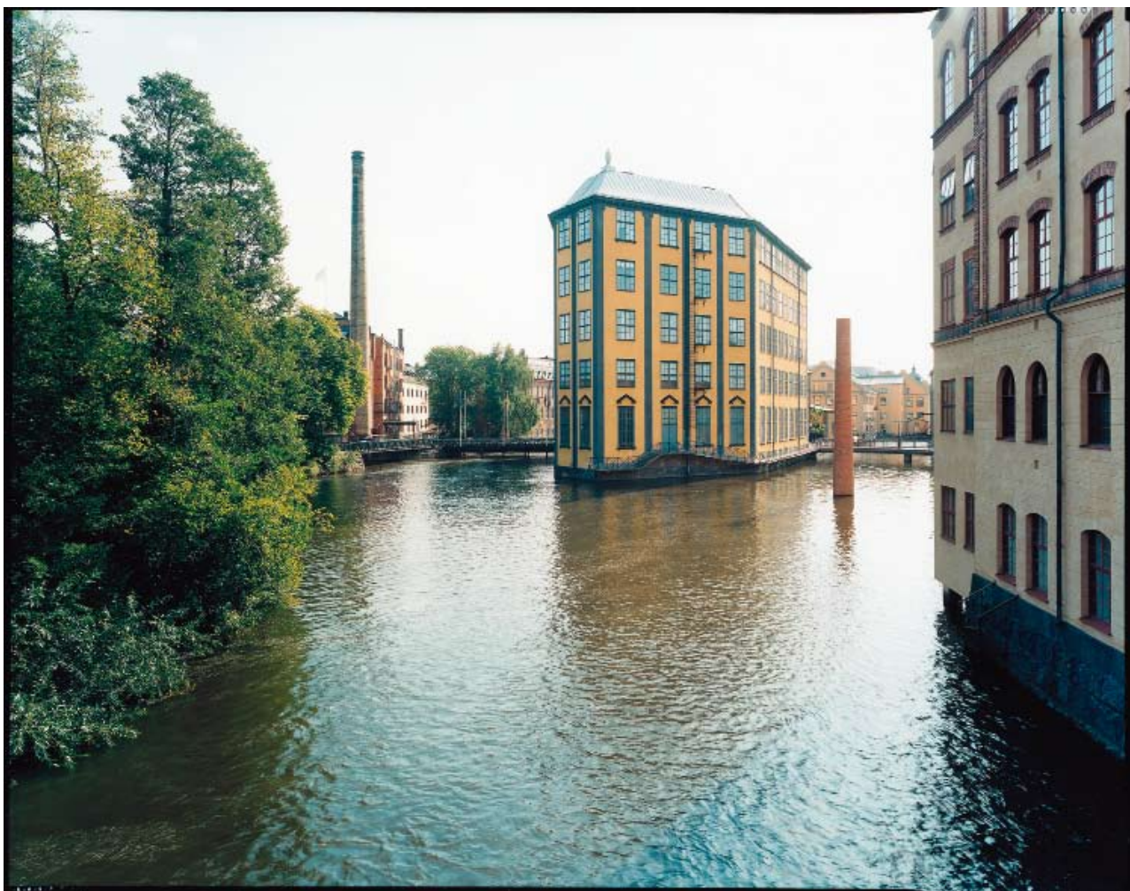
"Den femte skorstenen", 14 m, Motala Ström, Norrköping 1999

– Jag har haft många offentliga uppdrag i Sverige men de senaste var för tre år sedan, så kanske är det slut med det nu.