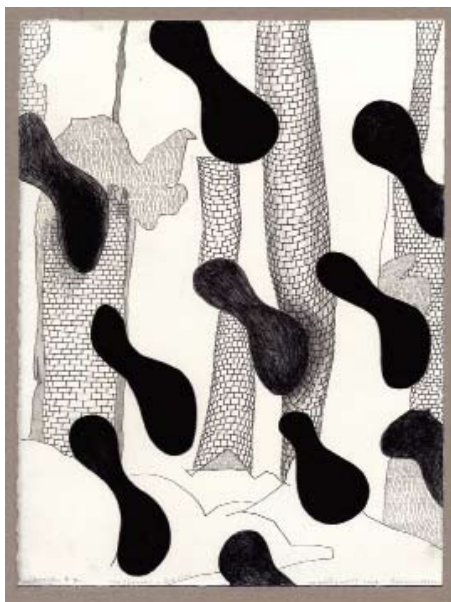
"Skorsten # 7", blyerts 2007