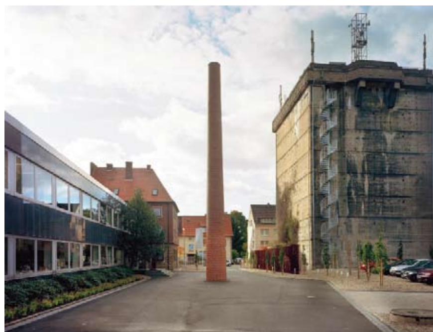
"Den nionde skorstenen", 18 m, Firma Jäckering, Hamm, Tyskland 2008

– Det är ett sätt att översätta mig själv. Det har alltid fascinerat mig. Och som konstnär är man själv ansvarig för att skapa ett språk, ett material som åskådaren känner igen. Det blir ett uttryck som konstnären bestämmer. Om mina projekt är intressanta för mig – så hoppas jag att de är intressanta för andra. ✿