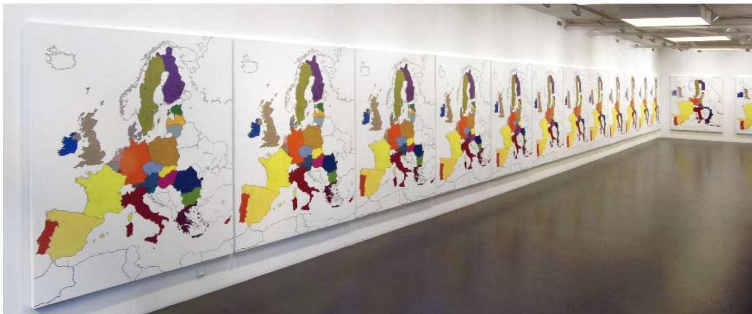
"Psycho-Mapping Europe version 2.0" 20 målningar 2007-2009. Installationsbild från Galleri Flach+Thulin, Stockholm 2009