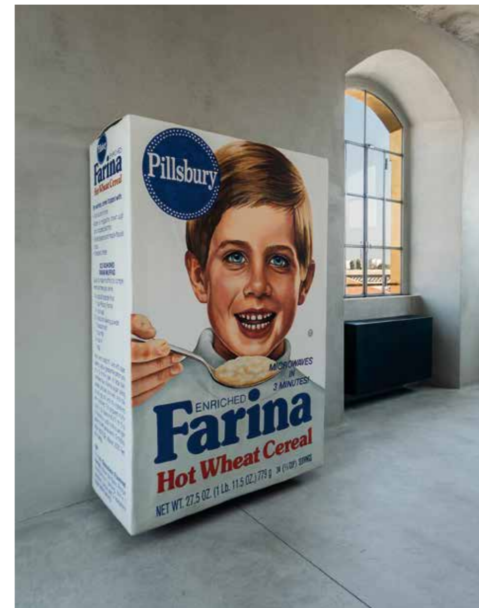
Robert Gober, UNTITLED , 1993–1994. Foto av Attilio Maranzano, Courtesy Fondazione Prada