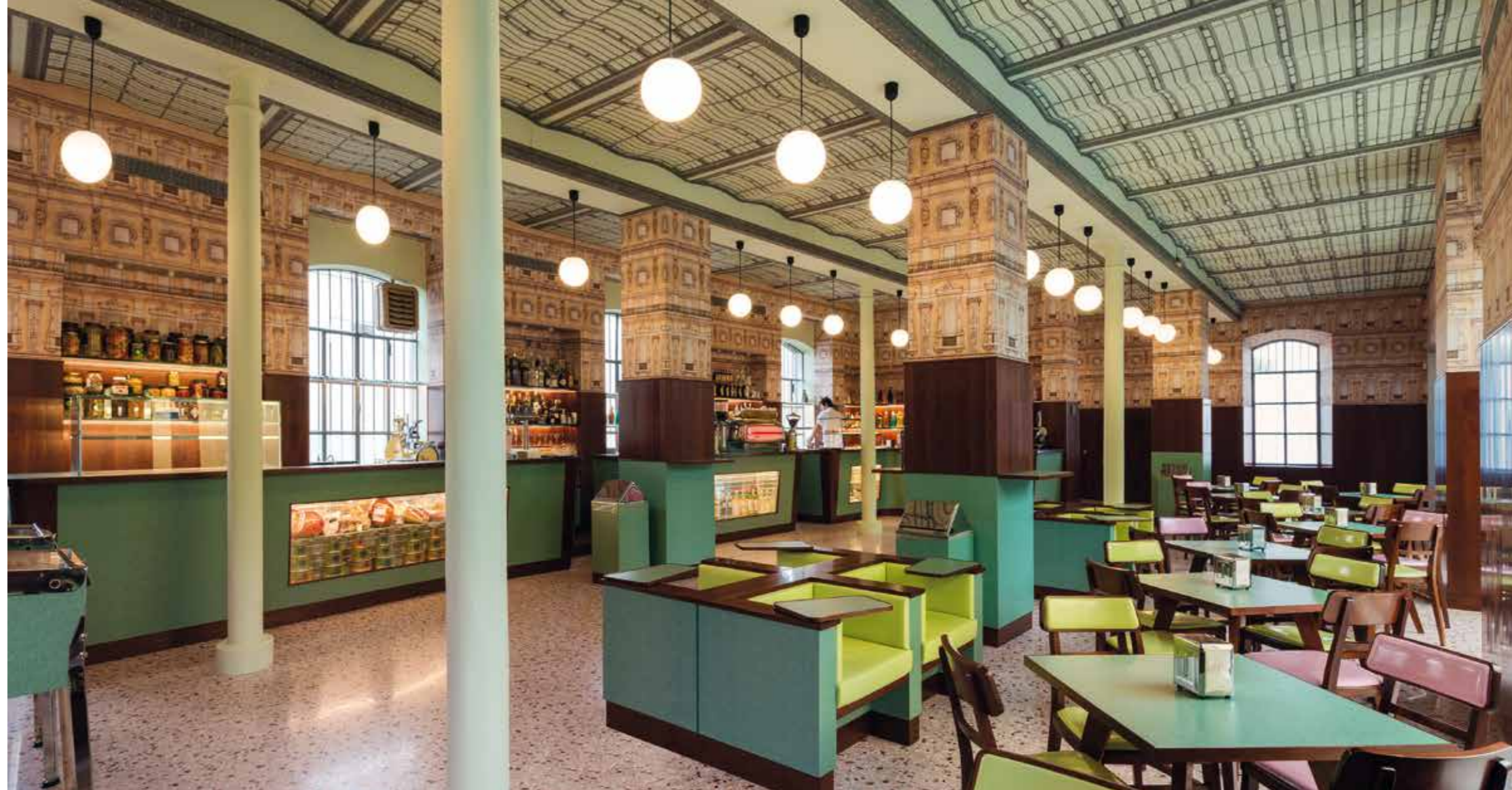
Regissören Wes Anderson har inrett Fondazione Pradas supercoola servering Bar Luce.

utställningssalar (jämför med Moderna Museets 4 900 kvadratmeter totalt), ett bibliotek, en scen, en biograf, ett generöst utrymme för barnverksamhet, en kontorsdel och en stor servering. Ingenstans syns själva varumärket Prada. Inga väskor, inga kläder. Det här är ett hus för kultur, rätt och slätt.