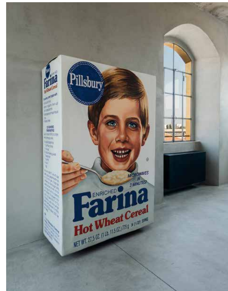
Robert Gober, UNTITLED , 1993–1994. Foto av Attilio Maranzano, Courtesy Fondazione Prada