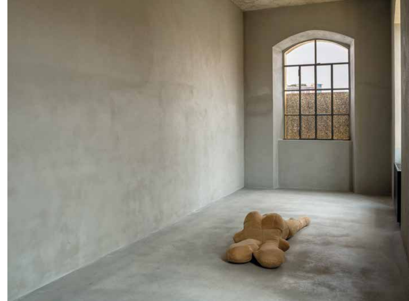
Louise Bourgeois, SINGLE III , 1996.