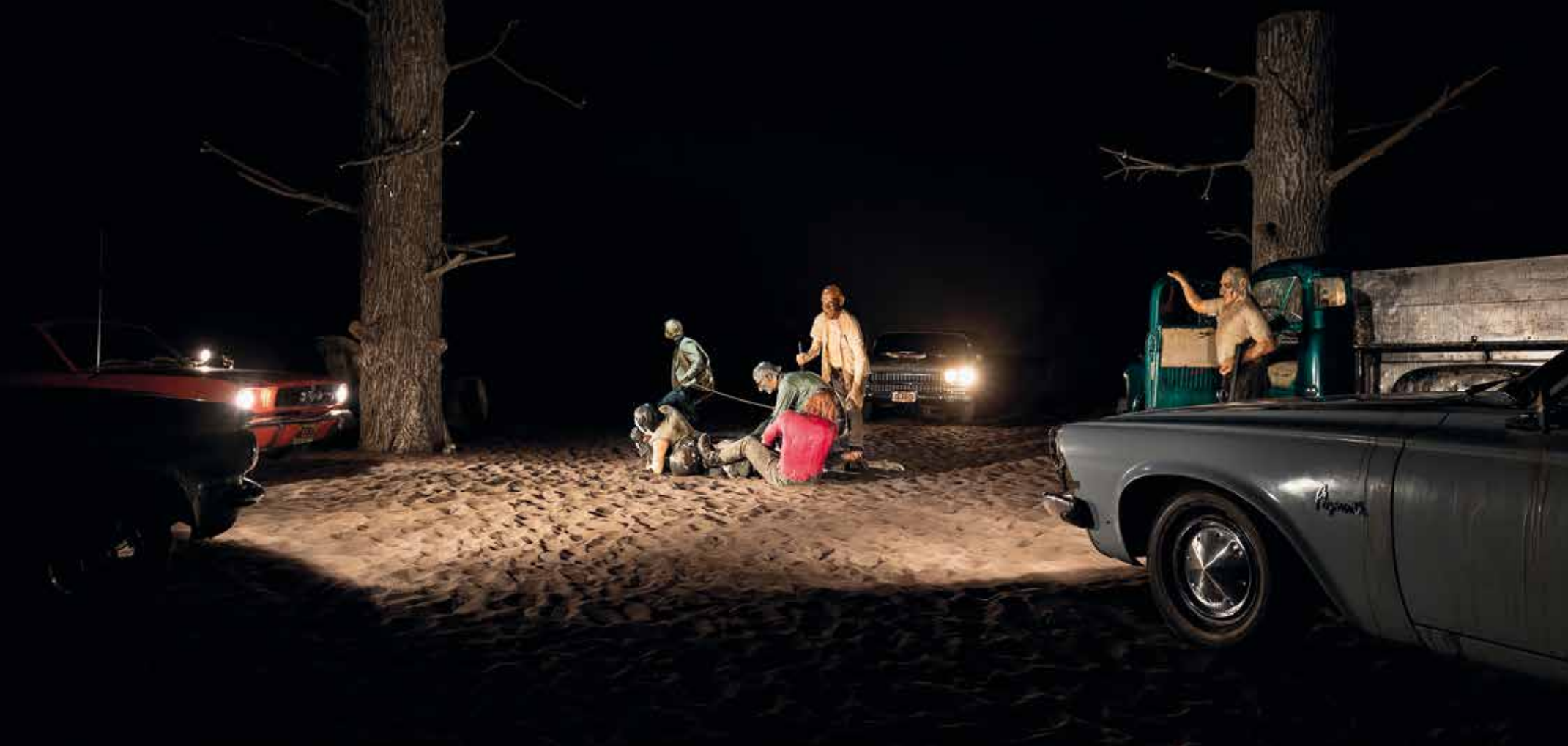
Edward Kienholz, FIVE CAR STUD , 1969–72.