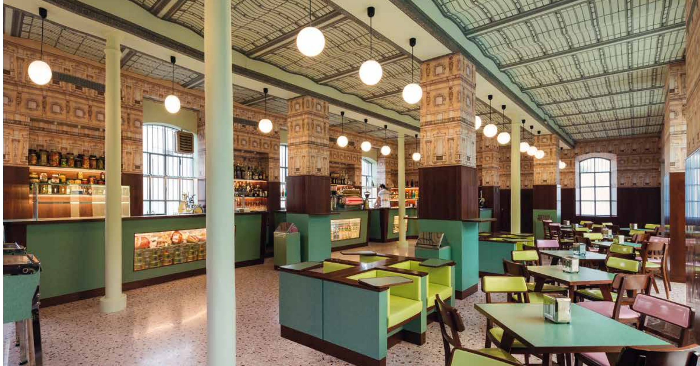
Regissören Wes Anderson har inrett Fondazione Pradas supercoola servering Bar Luce.

utställningssalar (jämför med Moderna Museets 4 900 kvadratmeter totalt), ett bibliotek, en scen, en biograf, ett generöst utrymme för barnverksamhet, en kontorsdel och en stor servering. Ingenstans syns själva varumärket Prada. Inga väskor, inga kläder. Det här är ett hus för kultur, rätt och slätt.