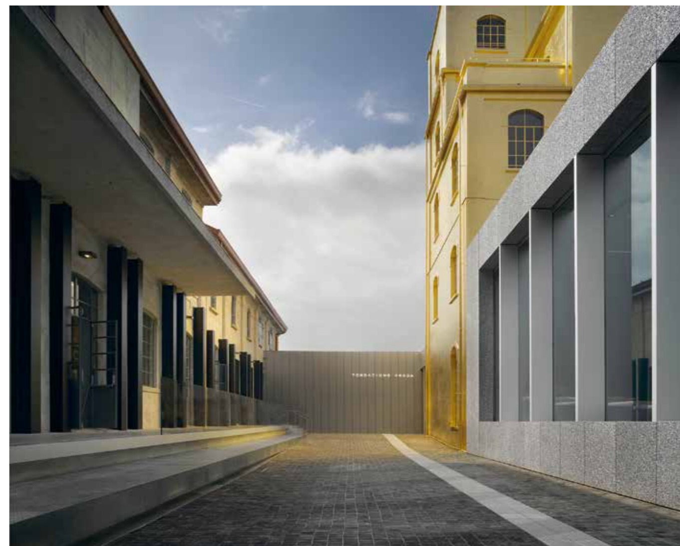
”Markbeläggningen fram till entrébyggnaden ser ut att vara gatsten, men är i själva verket tråklossar, lite ojämna och mörka.”