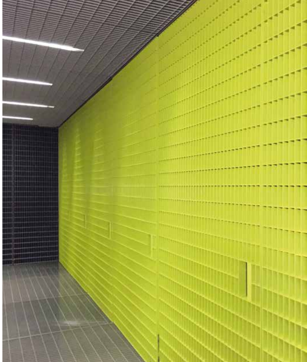
"Det är inte var dag folk jublar när de går in på en offentlig toalett."