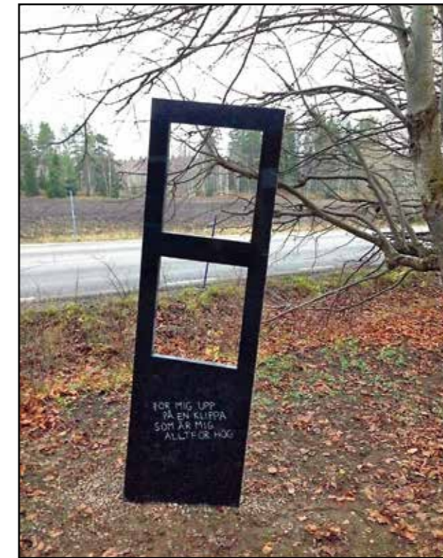
Trygve Luktvaslimos verk f33T